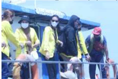
Gambar 1. Persiapan Menyebarkan Menuju Pulau Panggang

Perizinan dilakukan dengan terlebih dahulu meminta izin melakukan kegiatan KKN kepada Kelurahan Pulau Panggang, Kecamatan Kepulauan Seribu Utara, Kabupaten Kepulauan Seribu. Setelah mendapatkan izin dari pihak kelurahan maka tim melakukan koordinasi untuk melakukan persiapan kegiatan KKN dan berangkat menuju pulau panggang.