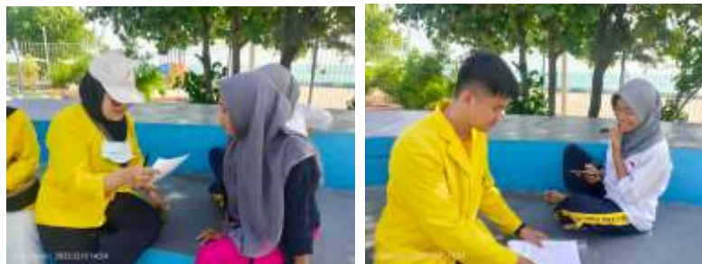
Gambar 4. Kegiatan Penyuluhan pada Remaja

Kelompok ini merupakan kelompok yang paling rentan terhadap penyalahgunaan narkoba. Penyuluhan perlu menekankan bahaya narkoba bagi kesehatan, masa depan, dan lingkungan