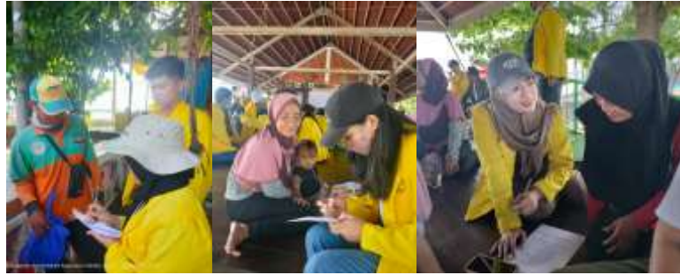
Gambar 5. Kegiatan Penyuluhan Pada Masyarakat

Sebagai langkah awal Penyuluhan hari Pertama di Pulau Panggang pada tanggal 15 desember 2023 di Kepulauan Seribu. Pada kegiatan hari pertama dengan Tema Bahaya Narkoba, kusioner dibagikan kepada masyarakat dengan cara berkeliling pulau panggang. Pertanyaan-pertanyaan terkait pengetahuan dan pengalaman mereka tentang narkoba dan akan menjadi landasan untuk merumuskan strategi edukasi yang tepat sasaran. Setelah memberikan beberapa pertanyaan pada kusioner yang telah kami bagikan kepada masyarakat. Hasil kesimpulannya yaitu 100% dari masyarakat sekitar tahu apa itu narkoba dan seperti apa bahaya Narkoba untuk diri kita. Beberapa dari masyarakat juga merasakan dampak negatifnya dari Narkoba.