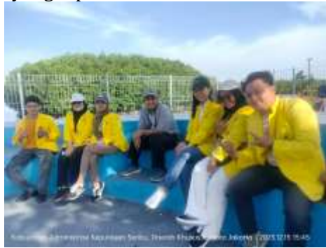
Gambar 3. Persiapan Tim Penyuluhan dan Survei Bahaya Narkoba

Maraknya isu penyalahgunaan narkoba yang kian mengkhawatirkan, peran mahasiswa mengedukasi masyarakat menjadi kian penting. Kesempatan kegiatan KKN menjadi momen ideal bagi para mahasiswa dan dosen untuk berkontribusi nyata dalam memerangi bahaya narkoba. Salah satu bentuk kontribusi yang efektif adalah dengan mengadakan survei dan edukasi kepada masyarakat. Survei ini bertujuan untuk menggali informasi mengenai tingkat pengetahuan dan pemahaman masyarakat mengenai bahaya narkoba, serta pola penyalahgunaannya. Data yang diperoleh dari survei ini kemudian dijadikan dasar untuk merumuskan strategi edukasi yang tepat sasaran.