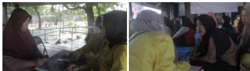
Gambar 8. Kegiatan Konsultasi Kesehatan

Hasil pengecekan dan konsultasi kesehatan didapat bahwa sebagian besar masyarakat pulau panggang memiliki kadar kolesterol yang tinggi. Tingginya kadar kolesterol masyarakat ini terjadi karena sebagian besar masyarakat pulau panggang sering mengonsumsi makanan yang diproses dengan cara digoreng. Hasil ini dipertegas dengan hasil konsultasi kesehatan dimana kesukaan mengonsumsi makanan yang digoreng karena mereka tinggal di kepulauan dan akses untuk sayur mayor tergolong sulit dan walaupun ada harganya akan lebih mahal daripada masyarakat pada daratan.