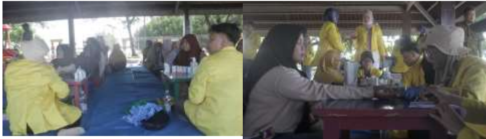
Gambar 7. Kegiatan Pengecekan kesehatan

Pengecekan dan konsultasi kesehatan dilakukan pada sela-sela kegiatan KKN yang dilakukan pada tanggal 16 Desember 2023 yang dikonsentrasikan pada RPTRA Tonjong Timur pada pulau panggang. Kegiatan ini diawali dengan masyarakat melakukan regristrasi. Setelah melakukan regristrasi masyarakat dapat segera melakukan pengecekan kesahatan maupun konsultasi kepada tim mahasiswa dan dosen farmasi IST Al-Kamal.